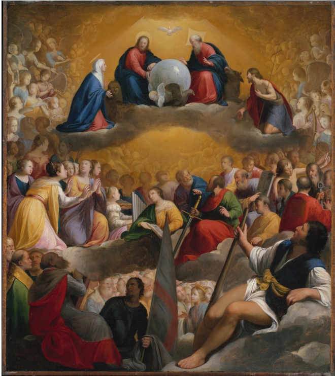
Le paradis est souvent représenté avec des humains - Carlo Saraceni